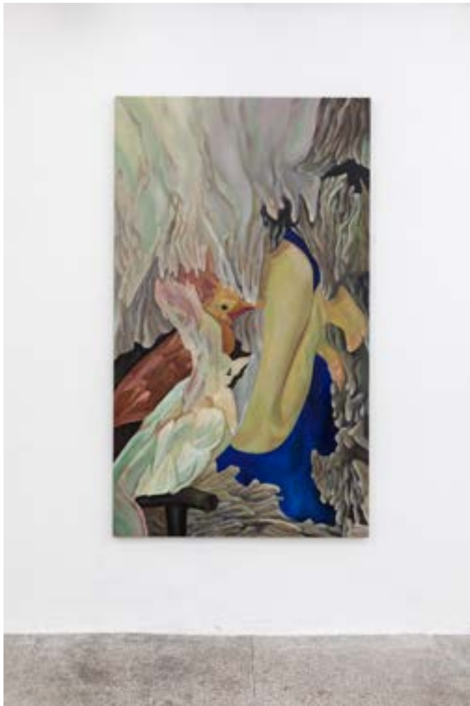
Giorgia Garzilli, Berry tutto ciò che hai visto è vero , 2021.

Giorgia Garzilli compose ses tableaux comme des collages dans lesquels se rencontrent des images inspirées du réel et d'autres ancrées dans l'imaginaire. Dans ses compositions, le magique et le quotidien se superposent. Imbriquées ou renversées, les choses banales représentées nous semblent irréelles. À l'inverse, l'artiste fait passer pour évidente la bizarrerie: un paysage montagneux se dissimule dans le pavillon d'une oreille et un couple de poissons combattants habitent les profondeurs de l'Atlantide ou le fond de sacs. Les mondes de Giorgia Garzilli ont une panoplie de lectures possibles. Dans les textes qui accompagnent parfois ses tableaux, l'artiste propose des alternatives ou des suites aux intrigues représentées. Elle poursuit alors à l'écrit ses hallucinations et rébus, que ce soit dans des nouvelles ou dans les longs titres qu'elle choisit pour ses peintures.