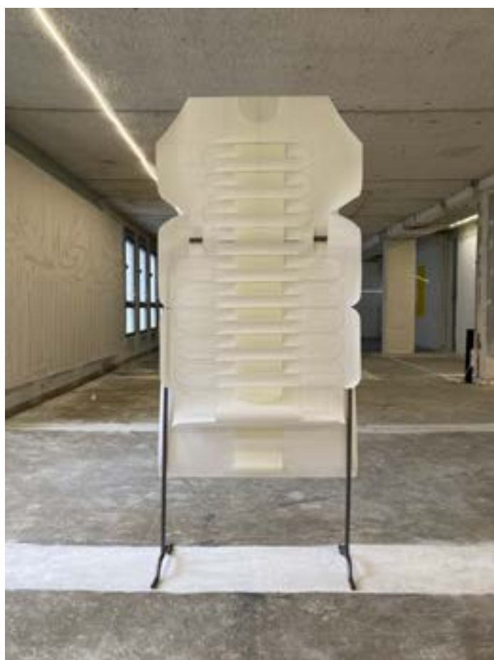
Chloé Vanderstraeten, Colonne vertébrale , 2023. Courtesy de l'artiste. ©Adagp, Paris, 2023.

Chloé Vanderstraeten se consacre à la pratique du dessin et du pliage sur papier. Elle crée ce qu'elle définit elle-même comme des «architectures de papier», imaginées et déployées sur la feuille exposée en volume. La question du mouvement est très importante dans la pratique de l'artiste, à différents niveaux. Il y a d'abord ses propres mouvements lorsqu'elle dessine. Il y a ensuite des mouvements que Chloé Vanderstraeten observe dans ce qui l'entoure et qu'elle retranscrit dans ses dessins, où des formes tracées avec précision rencontrent des flux colorés beaucoup plus libres. L'artiste utilise des méthodes de dessin liées à des domaines techniques ou scientifiques pour transcrire et interpréter poétiquement des gestes quotidiens, des activités partagées par la plupart d'entre nous – rêver, respirer, jouer, écouter, cultiver. Elle propose par exemple une interprétation du temps du rêve par une accumulation de petites bulles colorées qui, comme les pensées, se rencontrent et fusionnent.