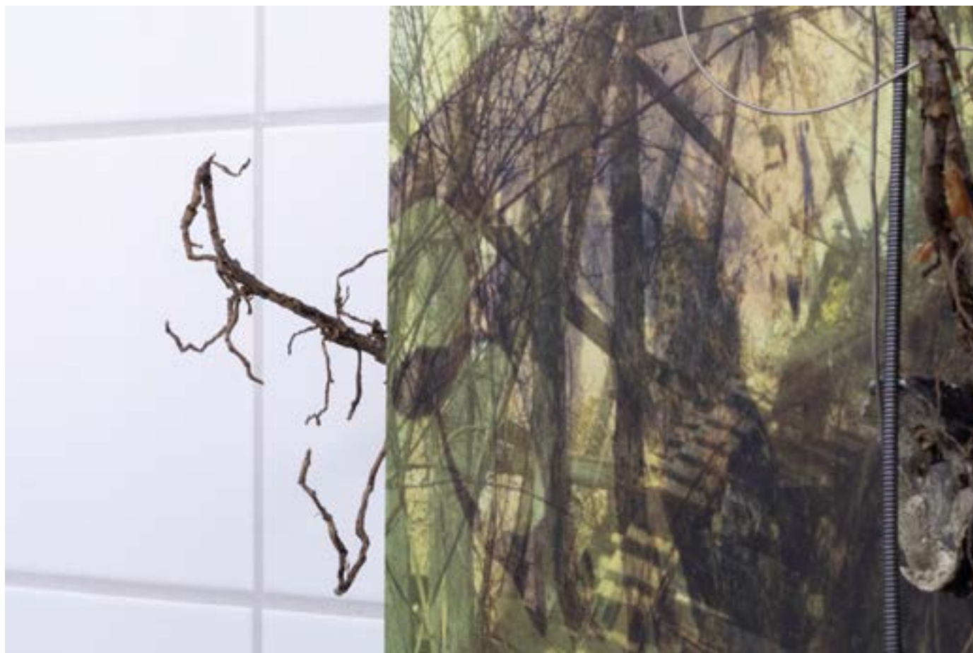
Victor Gogly, Détail de Its thorns did brightly shine, piercing the ground , 2021. Photo: Sakari Tervo. ©Adagp, Paris, 2023.

Victor Gogly porte attention aux territoires qu'il parcourt. En déambulant sur des terrains vagues, dans la forêt, sur des chemins ou en bord de mer, il tente de comprendre comment différentes entités humaines, non humaines, vivantes et non vivantes coexistent bien qu'elles aient chacune leur rythme. Lors de ces explorations, Victor Gogly ramasse de nombreux matériaux organiques et objets manufacturés. Il photographie également certains détails, et enregistre les sons qui l'entourent. Sur certaines compositions, on peut ainsi deviner la présence d'objets métalliques usinés tels des câbles, qui se confondent avec de petites branches. La plupart de ces éléments sont recouverts de paraffine fondue teintée dans un violet presque noir. Cette matière dérivée du pétrole intéresse l'artiste comme le produit d'une lente dégradation de restes organiques pendant des millions d'années. Il souligne ainsi le lien entre notre présent et les origines du vivant, et lie des domaines industriels et naturels généralement opposés.