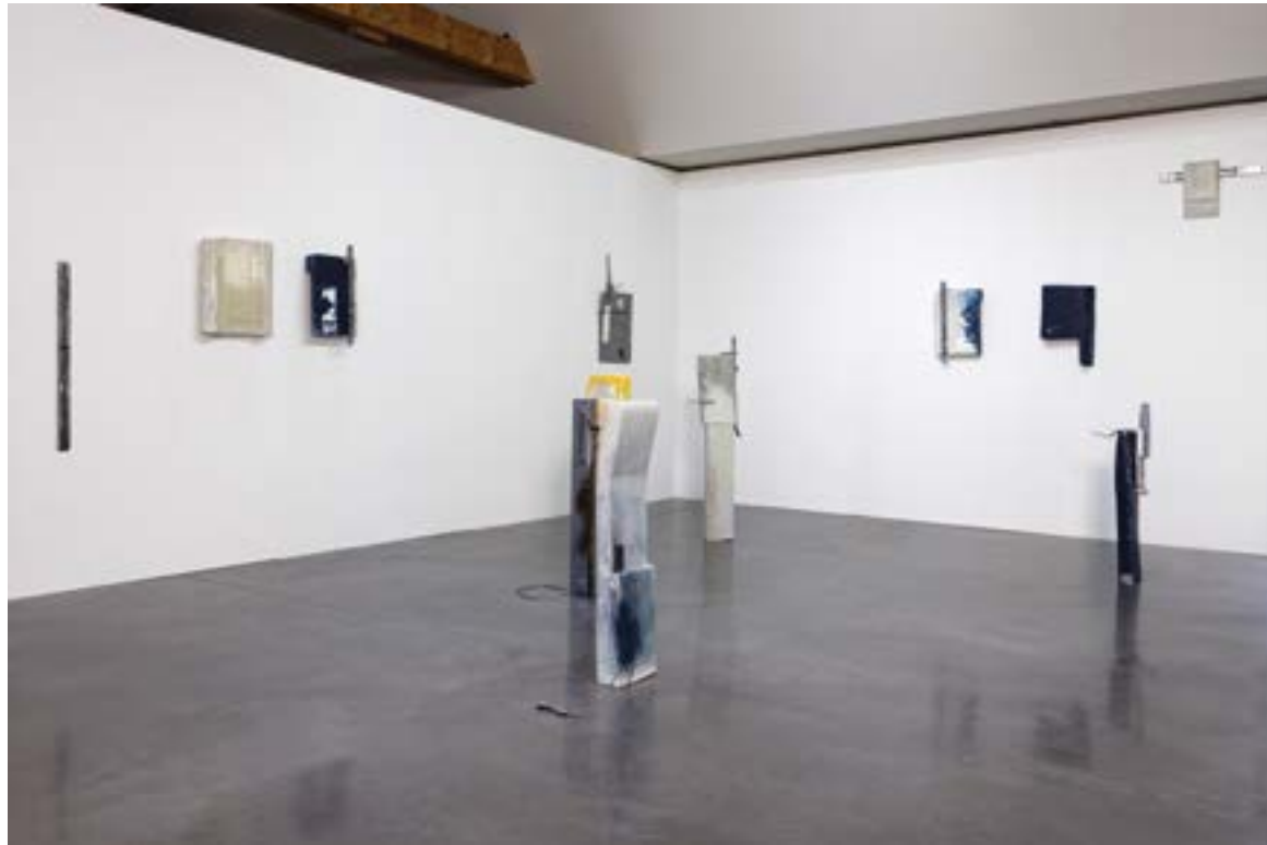
Margot Pietri, l'mfascia , 2020. Vue d'exposition personnelle de l'artiste, programme ex situ «Galeries Nomades» de l'IAC Villeurbanne au musée de Céramique à Lezoux.

À la croisée de la sculpture et de la peinture, les œuvres de Margot Pietri se lisent en surface et en profondeur. L'on peut choisir de parcourir les textures des divers matériaux employés—le métal, la fibre de verre, la résine, la jesmonite—ou d'en explorer la stratification. Margot Pietri imagine une fiction post-soleil, où la terre aurait perdu son astre repère, entraînant le chamboulement des normes liées au temps et à son organisation. Plus besoin d'évaluer la direction, de mesurer le poids ou la température dans un environnement où il n'y a plus d'alternance entre le jour et la nuit. Si certaines œuvres reprennent les formes de calendriers, boussoles, balances et thermomètres, ces objets ont perdu leur fonction. Les émotions humaines ont aussi souffert de ce tournant historique imaginaire. Le lexique lié aux états d'esprit terriens s'ouvre à de nouvelles manières d'exprimer les ressentis. Le corpus d'emojis et autres caractères spéciaux que l'artiste collecte et réemploie dans ses œuvres est la base de ce vocabulaire en construction. Également autrice de micro-nouvelles, Margot Pietri évoque ses sculptures et peintures dans les scénarios de ses histoires. Elle se sert de cet imaginaire pour parler de la naissance d'un monde nouveau: après l'effondrement d'une réalité, le dérèglement généralisé cède la place à la réinvention.