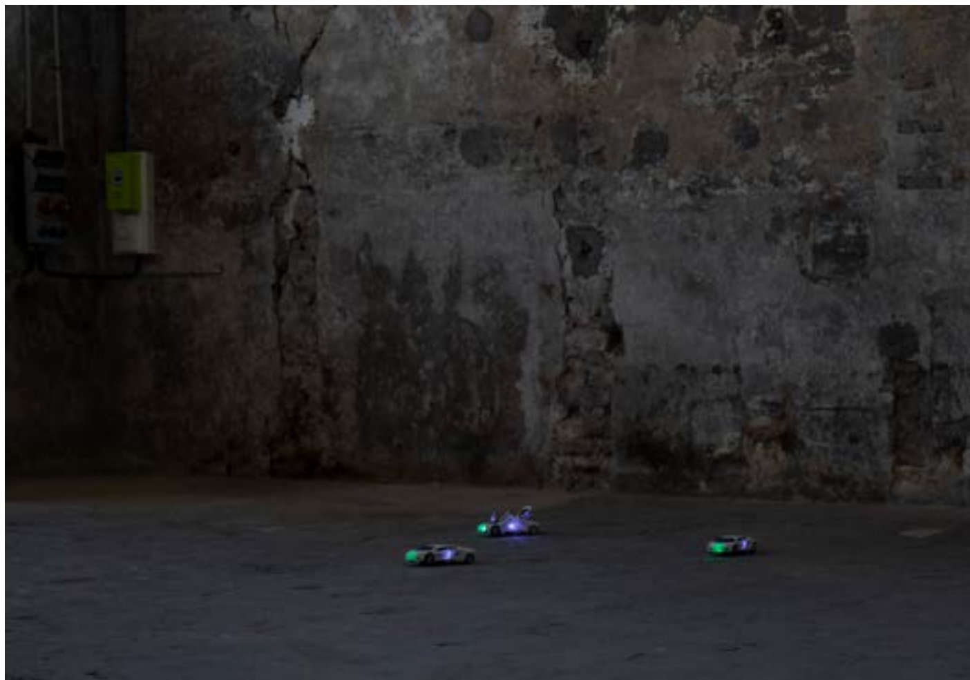
Andréa Spartà, A Knife in The Sun , 2023 Vue de l'exposition personnelle «A Knife In The Sun», White Cubi, Dijon, 2023. Photo: Anne Eppler. ©Adagp, Paris, 2023.

Andréa Spartà crée des installations et des sculptures à partir d'objets liés aux univers domestique et quotidien, qu'il agence minutieusement pour en détourner les usages : des nattes tressées deviennent par exemple des sculptures suspendues. Les œuvres d'Andréa Spartà intègrent souvent des matériaux vivants, tels que des fruits et des légumes. Ils se dégradent au fil de l'exposition, contrastant avec les matériaux inorganiques qui les accompagnent et qui restent inchangés. En composant ces natures mortes sous forme d'installations et de sculptures, l'artiste suggère que chaque chose a son propre rapport au temps. Il nous invite à une observation patiente de ces zones : des espaces de narration incertains qui semblent avoir leur propre règle et temporalité, mais qui rappellent néanmoins une réalité quotidienne partagée par tou·tes.