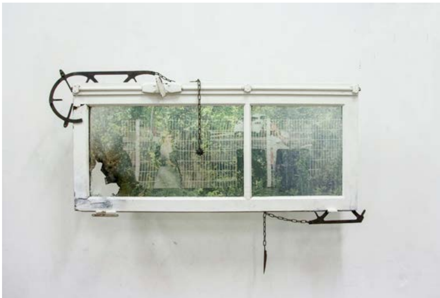
Célia Boulesteix, Mystery Train , 2022.

Célia Boulesteix considère l'espace urbain comme le réservoir d'un nombre infini de petites histoires. En arpentant les rues, elle récolte des objets et relève des traces de présences passées: gravats, vieilles photographies, fragments d'affiches, vêtements anciens... Les divers éléments collectés sont agencés par le collage et le transfert. L'artiste les associe également avec de petits matériaux et objets pouvant résonner avec l'intimité de tout·e un·e chacun·e: des perles, des morceaux de tissu... La mise en relation de ces objets au passé inconnu, de ces images recomposées au présent et de ces empreintes de l'espace urbain brouille les temporalités et suggère de multiples narrations futures.