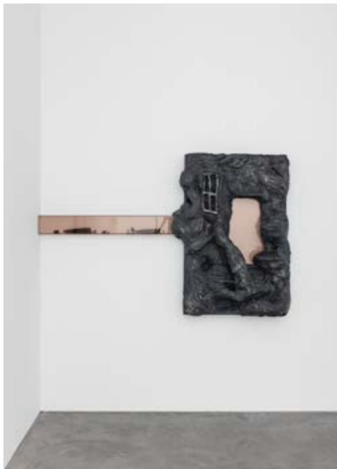
Loucia Carlier, We are volcanoes III , 2021.

Loucia Carlier travaille à partir de diverses sources de savoir dont elle extrait des éléments symboliques, visuels ou textuels, qu'elle rassemble ensuite dans ses œuvres. On peut voir le diorama d'une météorite prête à s'écraser sur un banc public; un brin d'ADN reproduit en bas-relief; des immeubles en forme de chapeau de sorcière. Nombre des cultures auxquelles Loucia Carlier emprunte ces symboles semblent avoir pour point commun d'être des «contre-cultures», avec un fort attrait pour l'occulte et le mystérieux. Dans certaines œuvres, l'artiste opère de troublants changements d'échelle. La reproduction miniature de mobilier de salle de réunion d'entreprise est par exemple placée dans ce qui ressemble à un souterrain. Nous sommes alors projeté-es dans une vision dystopique du futur, où seuls subsisteraient ces objets, vestiges tenaces de l'idéologie capitaliste ayant conduit à la catastrophe. L'aura narrative de ces œuvres, leur atmosphère secrète, plante le décor d'histoires que les visiteur·euses sont invité·es à s'imaginer.