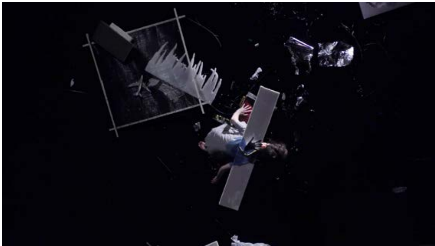
Louise Hallou, Préparation , 2018.

Louise Hallou crée des installations d'objets disparates, qu'elle active le plus souvent lors de performances. L'on peut observer d'étranges tiges métalliques auxquelles sont attachées des bandes de plastique multicolores, des surfaces plates réfléchissantes, des prothèses de doigts en scotch, des morceaux de fruits... Lors de ses performances, l'artiste manipule tour à tour les objets pour en faire des pièces de costume ou leur donner une autre forme. Ils deviennent une nouvelle peau ou des membres supplémentaires recouvrant son corps et suggérant une transformation. Sa propre peau est également importante. Elle est le support de mystérieux tatouages au feutre qu'elle trace sur ses bras, son visage ou la plante de ses pieds. Ces écritures apparaissent aussi sur l'intérieur de la peau de fruits épluchés, comme si elle avait réussi à inscrire un secret sous leur surface visible. Le secret a une place importante dans le travail de l'artiste, qui imagine en co-création avec des élèves d'élémentaire des communautés souterraines secrètes et marginales, leurs rites, fêtes et costumes.