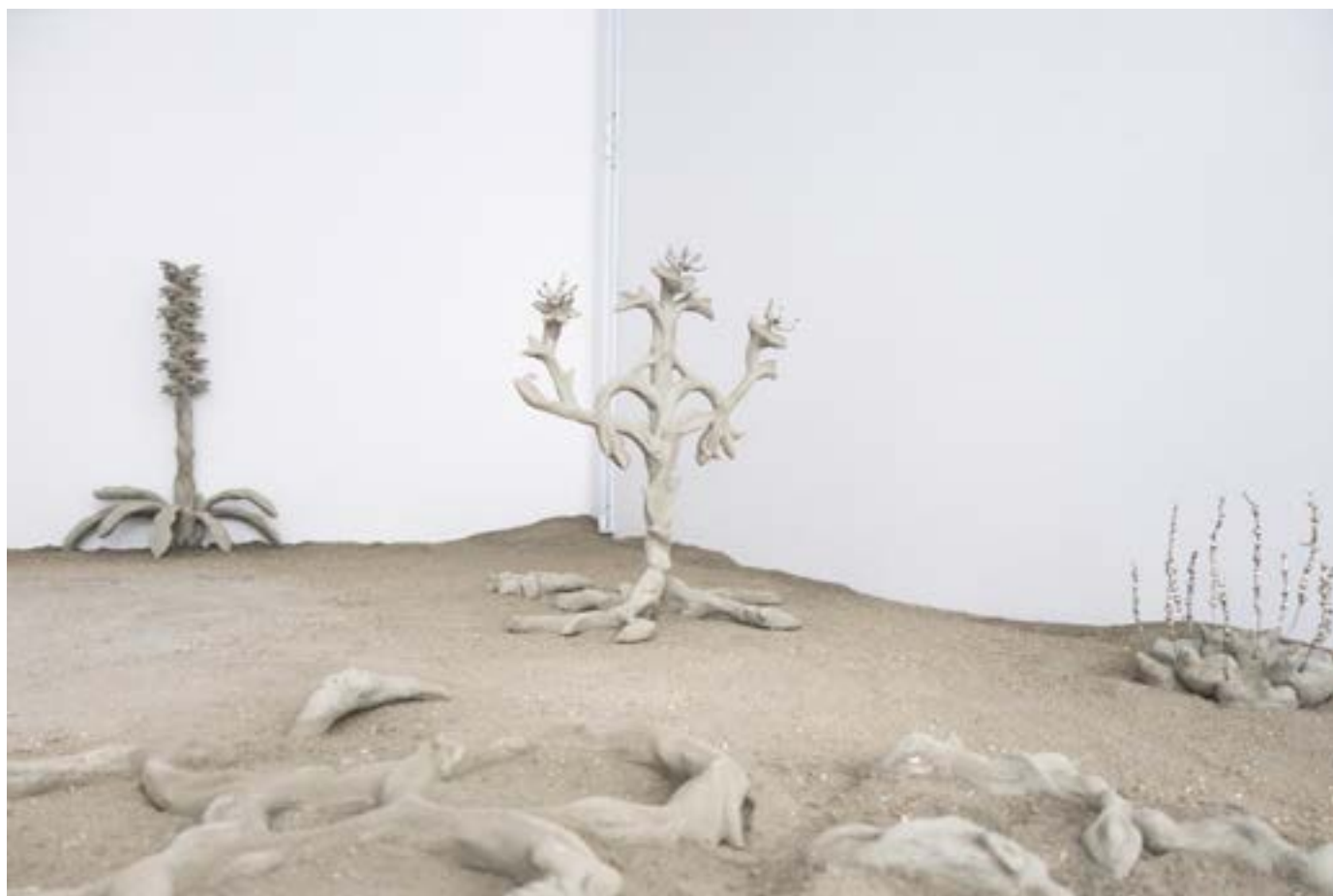
Xolo Cuintle, Weeping Sun . Vue d'exposition, Sainte Anne Gallery, 2021.

Le duo Xolo Cuintle est composé par Romy Texier et Valentin Vie Binet. Inspiré-es par les arts décoratifs, elles et ils utilisent dans leur travail des objets utilitaires et quotidiens: chaises, tables, luminaires... Ces meubles et éléments de décors, réalisés en béton, matériau habituellement réservé à la construction, semblent être des hybridations entre le mobilier, l'animal et le végétal. Certaines œuvres évoquent d'étranges plantes grimpantes transformées en luminaires, prenant racine dans le sol avant d'entrer dans le mur et de le percer à nouveau plus haut, comme si elles s'étaient mélangées avec l'espace. L'on ne sait pas si l'on se trouve en présence de fossiles d'un passé lointain ou d'un futur indéterminé. Par son aspect archéologique, leur travail nous permet d'imaginer que nous nous trouvons face aux restes de notre civilisation éteinte, dans un futur où les chaises de nos salles de réunion seraient issues d'un croisement entre le végétal et le minéral et où le béton serait devenu le principal composé géologique.