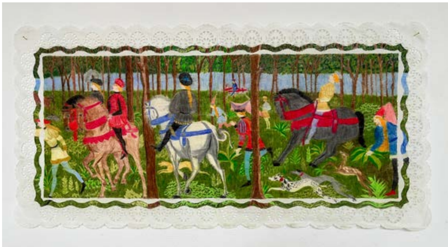
Héloïse Farago, Chasse au Patriarcat, Tortenspitzen , 2022.

Les dessins d'Héloïse Farago décorent des napperons en papier, ses sculptures sont de joyeux costumes à habiter et ses faïences brillent des couleurs vives de la peinture-émail. L'artiste déhiérarchise les pratiques artistiques, en changeant les supports des arts dits «classiques», comme la peinture et la sculpture. Elle se réapproprie les univers de la décoration, de l'accessoire, du kitsch, considérés comme propres à la culture féminine et souvent méprisés. Héloïse Farago propose des réécritures lesbiennes et féministes de mythes fondateurs et de fables d'antan, qu'elle met également en scène dans des vidéos et des performances musicales avec son alter ego TroubaDURE. La plupart des personnages qui peuplent l'imaginaire de l'artiste sont inspirés de l'histoire médiévale. Ses récits mettent en scène des figures féminines oubliées de cette période. Avec un humour tranchant, elle s'empare également de certains lieux communs de l'imagerie fantasy issus des visions fantasmées du Moyen Âge. Monstresses et chimères deviennent ainsi les compagnones d'héroïnes comme Jeanne de Belleville (XIV e siècle), femme pirate.