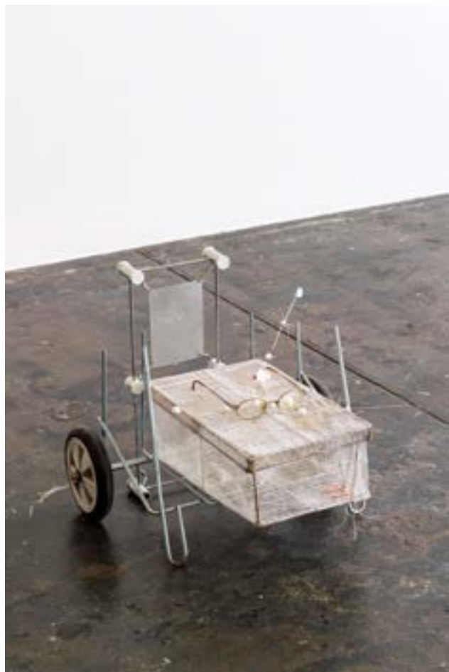
Ethan Assouline, Autonomie , 2022. Vue de l'exposition personnelle «2024», le Crédac, 2022.

Ethan Assouline s'approprié les images et les mots de la politique, de l'administration ou encore de la publicité. Il détourne ainsi dans ses œuvres une imagerie et un vocabulaire utilisés pour suggérer avec un optimisme forcé que « tout va bien », pour créer un simulacre de bonheur commun. Son travail d'installation repose en grande partie sur le détournement d'objets du quotidien, initialement destinés aux rebus. L'artiste crée des sculptures où des éléments de mobilier de seconde main sont associés avec des babioles, des branches de lunettes, des décorations, des perles en plastique... Ses œuvres nous plongent dans un univers urbain futuriste composé des déchets de la surconsommation contemporaine. Ethan Assouline souligne ainsi la fragilité du confort et de l'existence matérielle dans nos sociétés capitalistes. Ces installations, souvent précaires et ressemblant à des maquettes, pourraient être les ruines d'un futur déjà proche.