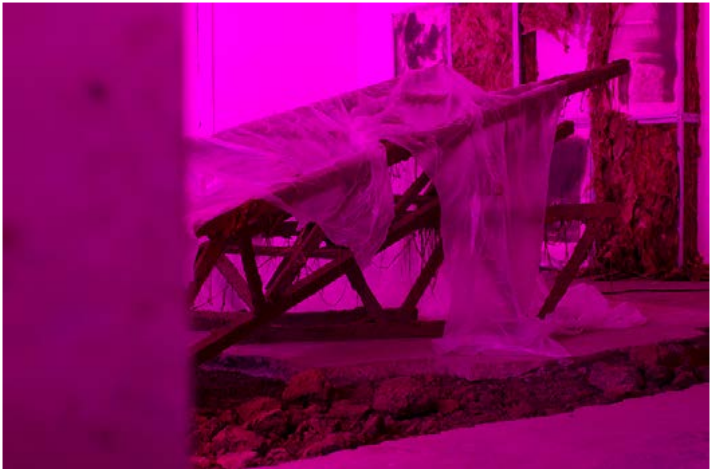
Collectif Grapain, Urban Reef, 2020. Vue de l'exposition «Urban Reef», Galerie Brutal, Hanovre, 2020.