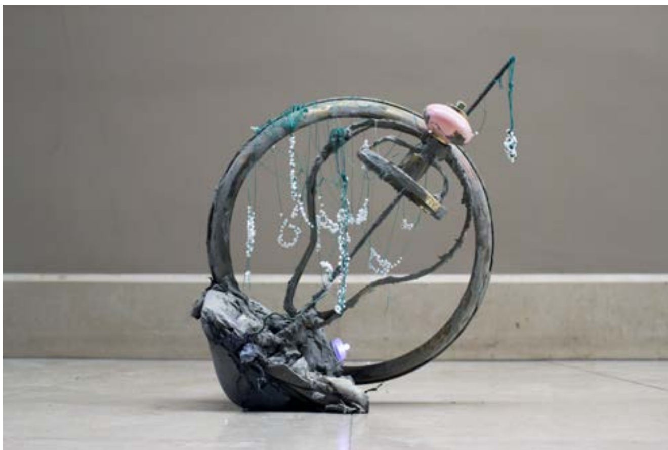
Pierre-Alexandre Savriacouty, R-3L , 2022. Courtesy de l'artiste. ©Adagp, Paris, 2023.

Quand un iceberg se fragmente en plusieurs éléments, ces derniers restent liés à l'«iceberg mère» grâce à leur système de codage. Inspiré par ce processus de formation de l'iceberg, Pierre-Alexandre Savriacouty considère que ses œuvres appartiennent à un système et sont connectées par le milieu aquatique. Il explore les mondes invisibles qui se cachent dans les profondeurs des eaux. L'image d'un fleuve desséché et des divers objets emprisonnés dans son fond a inspiré l'artiste pour concevoir ses «ancres». Dans ces sculptures, des déchets, des espèces vivantes, ou encore, des documents symboliques sont amalgamés dans du ciment. Des lustres, censés éclairer l'obscurité des eaux et faire la lumière sur les histoires oubliées, côtoient des plantes aquatiques et diverses archives. L'eau, que l'artiste prélève des rivières locales, sert à relier et hybrider ces divers éléments. Les «objets témoins» rassemblés par Pierre-Alexandre Savriacouty font remonter à la surface mythes, esprits et secrets cachés par la surface de l'eau. Ces dernières évoquent notamment le passé colonial qui a marqué l'histoire des mers et des océans.