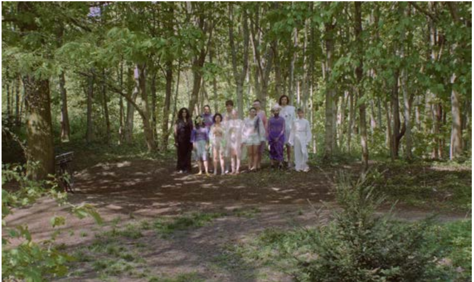
Aliha Thalien, L'Amour , 2021. Courtesy de l'artiste.

Aliha Thalien est une réalisatrice, vidéaste et plasticienne qui s'intéresse à l'intime et au vécu. Ses installations sont des espaces de parole et d'écoute. Des mots recueillis y circulent, enregistrés et rediffusés, gravés dans le métal ou imprimés sur du latex ou du tissu. Des récits personnels et collectifs animent aussi ses docu-fictions: ici, l'artiste est la témoin silencieuse des confessions et des luttes d'une jeunesse contemporaine. Dans une forêt aux portes de Paris, elle raconte les idées qu'ont ses proches de l'amour. En Martinique, elle se met à l'écoute d'un groupe de jeunes habitant·es et nous conte ce lieu «chargé en souvenirs», dont elle est originaire. Si l'artiste restitue avec sincérité les témoignages et les autobiographies qui lui ont été confiées, elle les transpose dans des contextes de fable. Elle explore également le subconscient, l'imagination et les rêves à travers en brouillant les narrations, créant ainsi des brèches vers d'autres réalités.